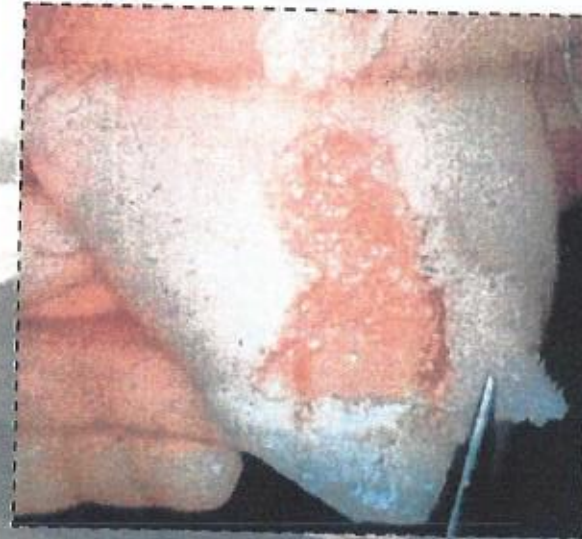
تقرحات شديدة باللسان