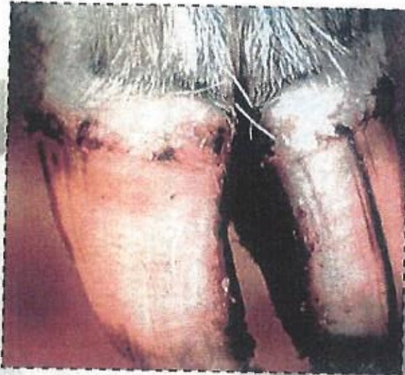
حويصلات بين الأظلاف