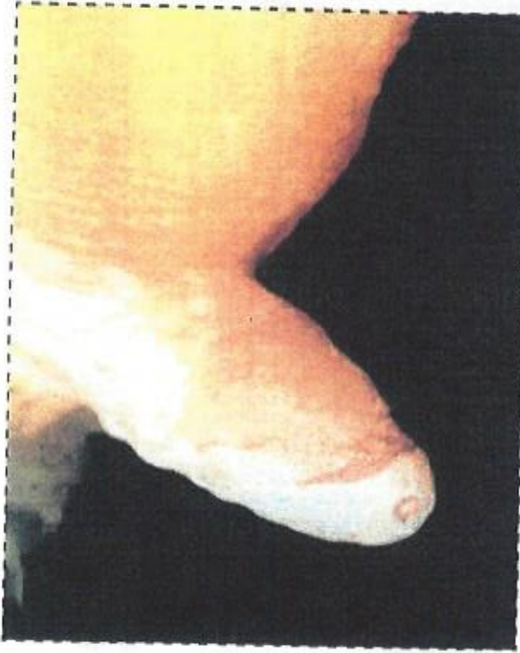
تقرحات في حلمات الضرع