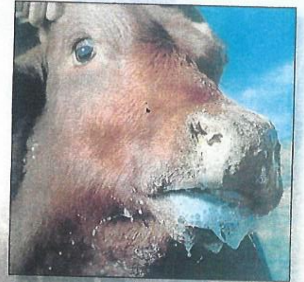
إفرازات لعابية من الفم